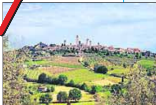
Toscane krijgt concurrentie van Marche.

Een tweede huis bezitten is nog steeds razend populair en allang niet meer alleen weggelegd voor de rijken. Naar schatting een half miljoen Nederlanders hebben een leuk tweede op-trekkje in het buitenland. Frankrijk en Spanje staan in de top tien, maar we zoeken het toch steeds verder weg. De trend op dit moment zijn Midden-Oosten en het Midden-Oosten. En koopjesjagers richten zich op nog 'karakteristiekere' bestemmingen.